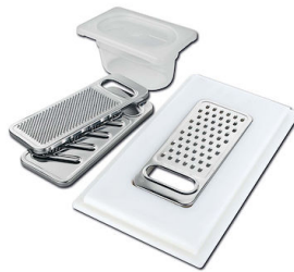
Kit râpes avec anneau de support et cuvette 8159 101 * uniquement en combinaison avec l'accessoire 8644 101