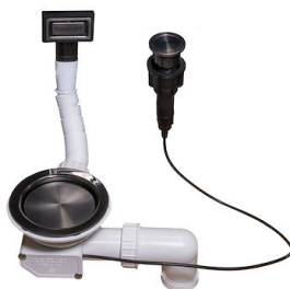
Vidange automatique Space Push Gun Metal - PO 8407 120