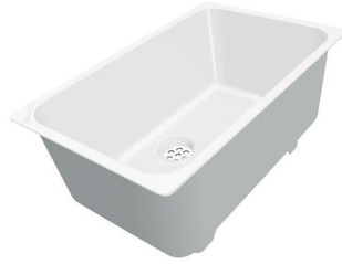
Cuvette blanche 8153 100