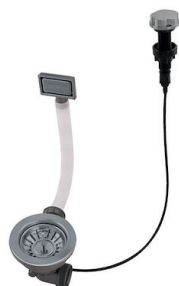
Vidange automatique Gun metal - PG 8407 110